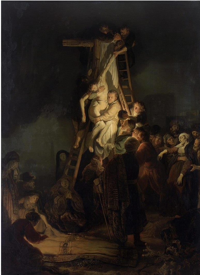
La descente de croix Rembrandt, 1634 Musée de l'Hermitage (Saint Pétersbourg)