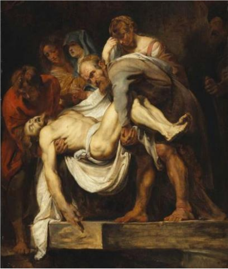
La descente de croix Rubens, entre 1612 et 1614 Musée des Beaux-Arts du Canada