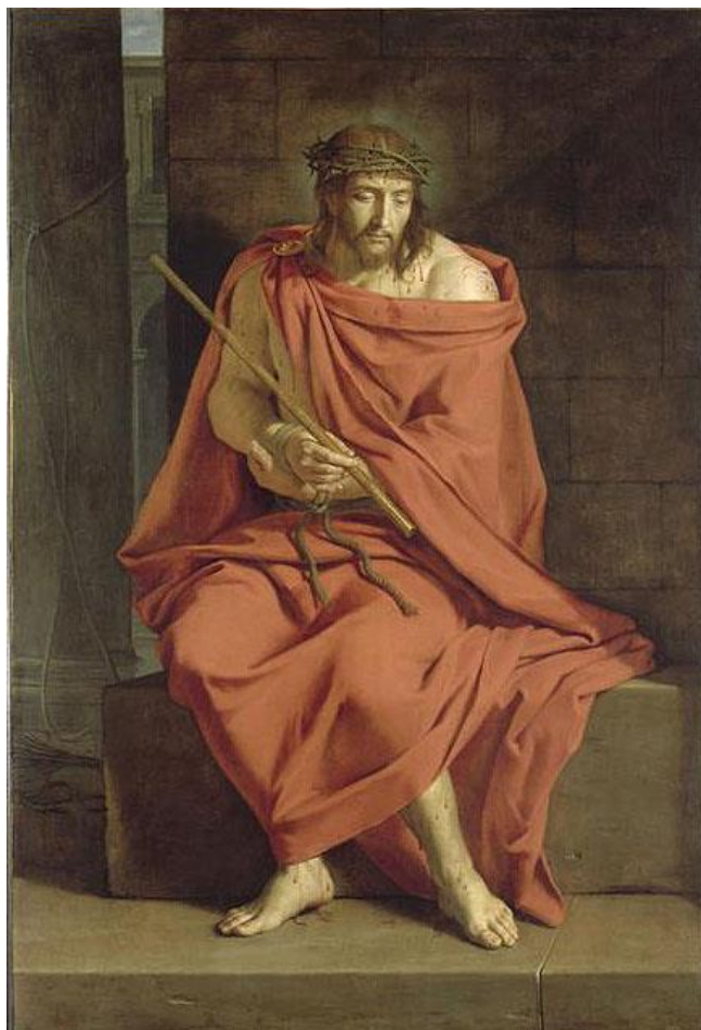
Christ aux outrages Philippe de Champaigne, vers 1655 Musée national de Port-Royal des Champs, Magny-les-Hameaux

le revêtit d'un manteau de couleur éclatante et le renvoya à Pilate. Ce jour-là, Hérode et Pilate devinrent des amis, alors qu'auparavant ils étaient ennemis.