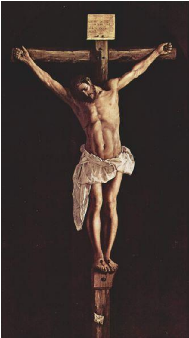
Christ en croix Francisco de Zurbarán, 1627 Art Institute of Chicago