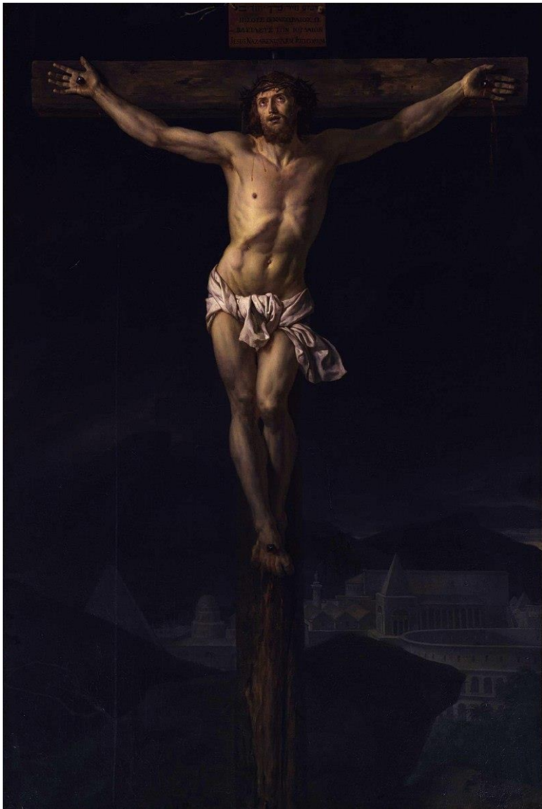
Le Christ en croix David, 1782 Eglise Saint Vincent de Macon