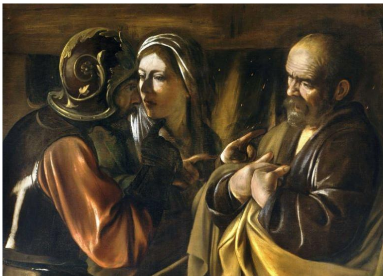
Le reniement de Saint Pierre Le Caravage, vers 1610 Metropolitan Museum of Art (New-York)

même, comme il parlait encore, un coq chanta. Le Seigneur, se retournant, posa son regard sur Pierre ; et Pierre se rappela la parole que le Seigneur lui avait dite : « Avant que le coq chante aujourd'hui, tu m'auras renié trois fois. » Il sortit et pleura amèrement.