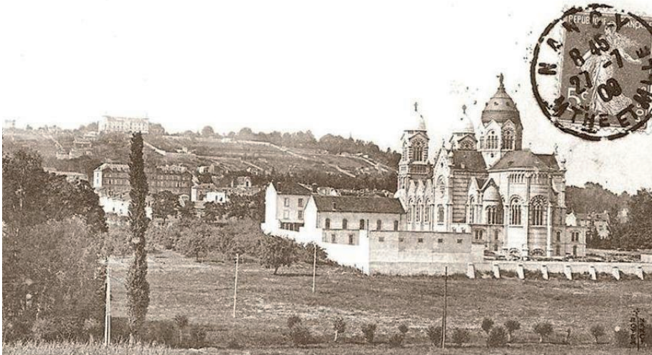
Autre vue avec le Sacré-Cœur et la Cure d'Air Des arbres au premier plan marquent l'emplacement du ruisseau Sainte-Anne