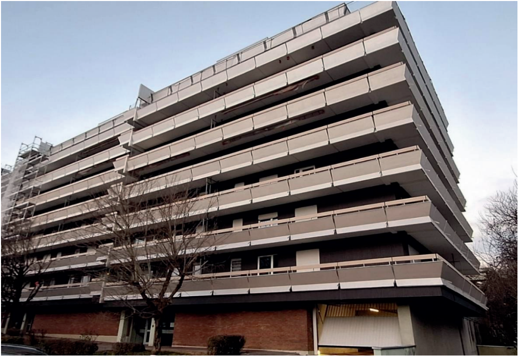
Le Clos sous son nouvel aspect rénové avec un dégradé de teintes s'éclaircissant du bas vers le haut (réfection pour la première des cinq phases – début 2025)