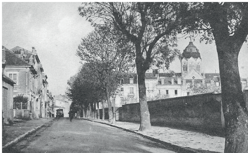
Rue de Laxou, le mur du domaine des Sœurs de Saint-Charles