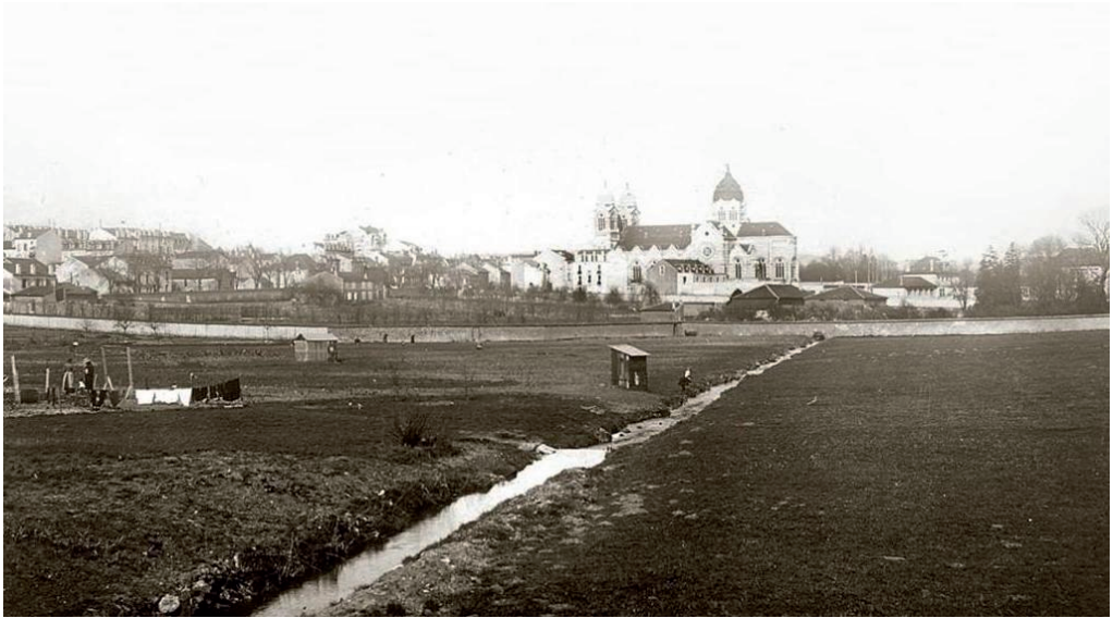
A l'époque où les terrains du Clos de Médreville étaient des jardins

En 1963, la Congrégation des Sœurs de Saint-Charles a cédé les terrains à la Société Civile Immobilière "le Clos de Médreville" pour la construction des résidences du Clos de Médreville et des Ducs de Bar.