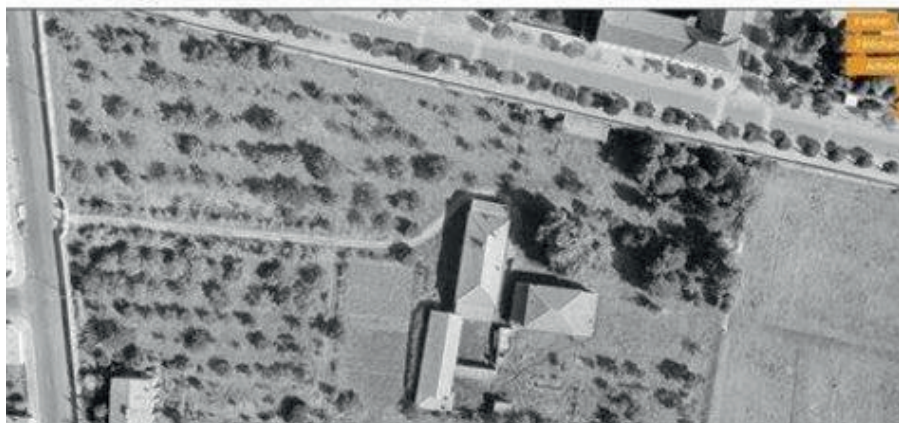
Le domaine des Sœurs de Saint-Charles avant la construction du Clos de Médreville