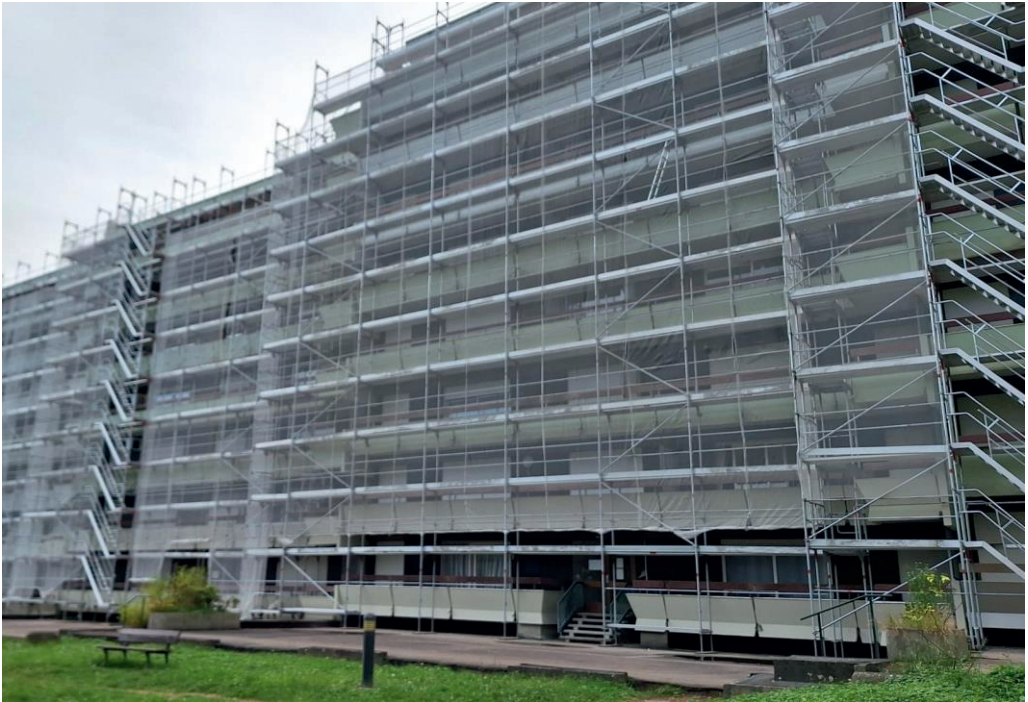
Les débuts du second ravalement du Clos de Médreville Les bâtiments « voilés » du côté de la rue Winston Churchill (automne 2024 - vue du parc)