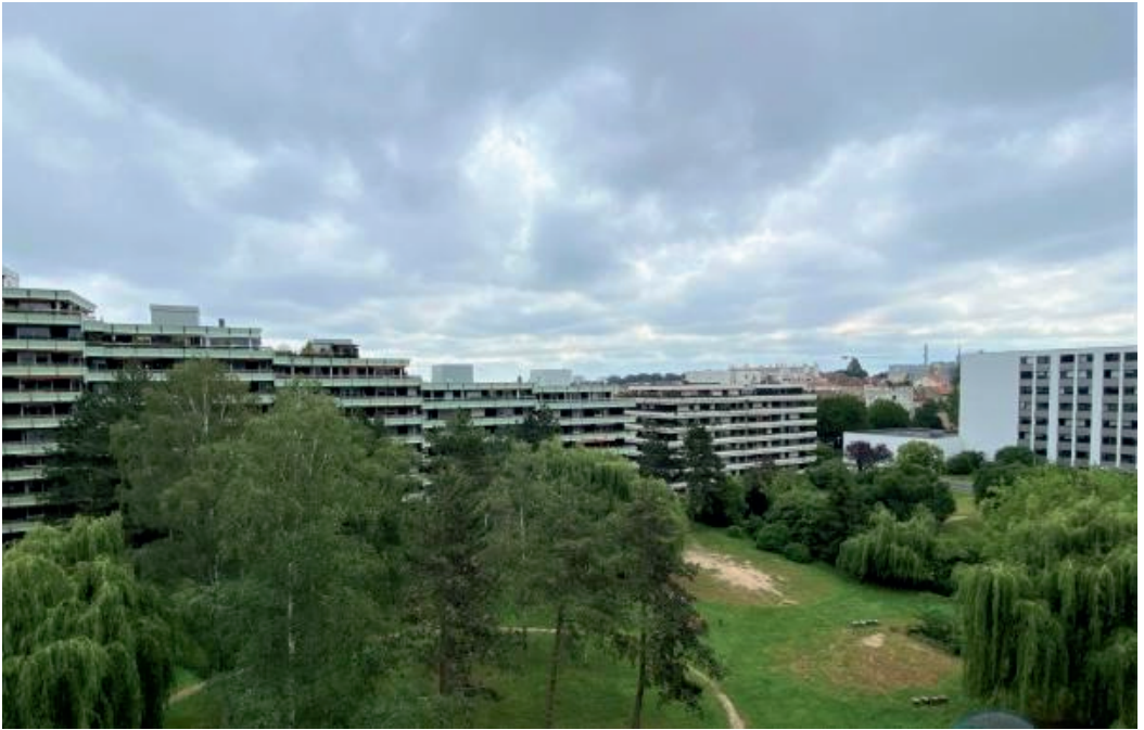
Le Clos avec sa teinte vert pâle après le premier ravalement (1990) Vue du parc Au fond, le bâtiment des Ducs de Bar et l'IUT