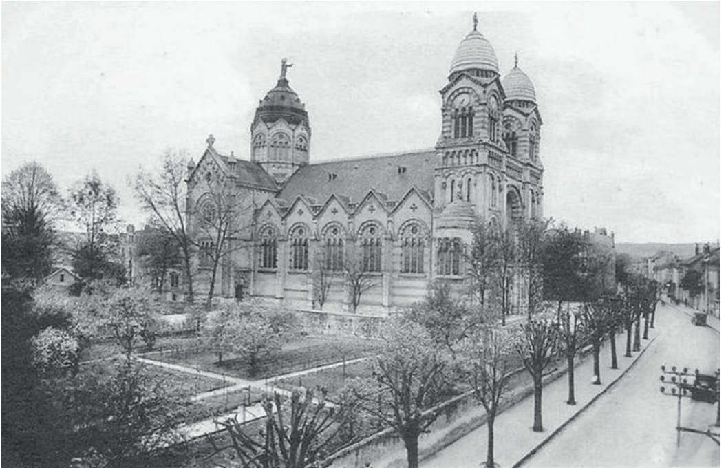
La Basilique du Sacré-Cœur