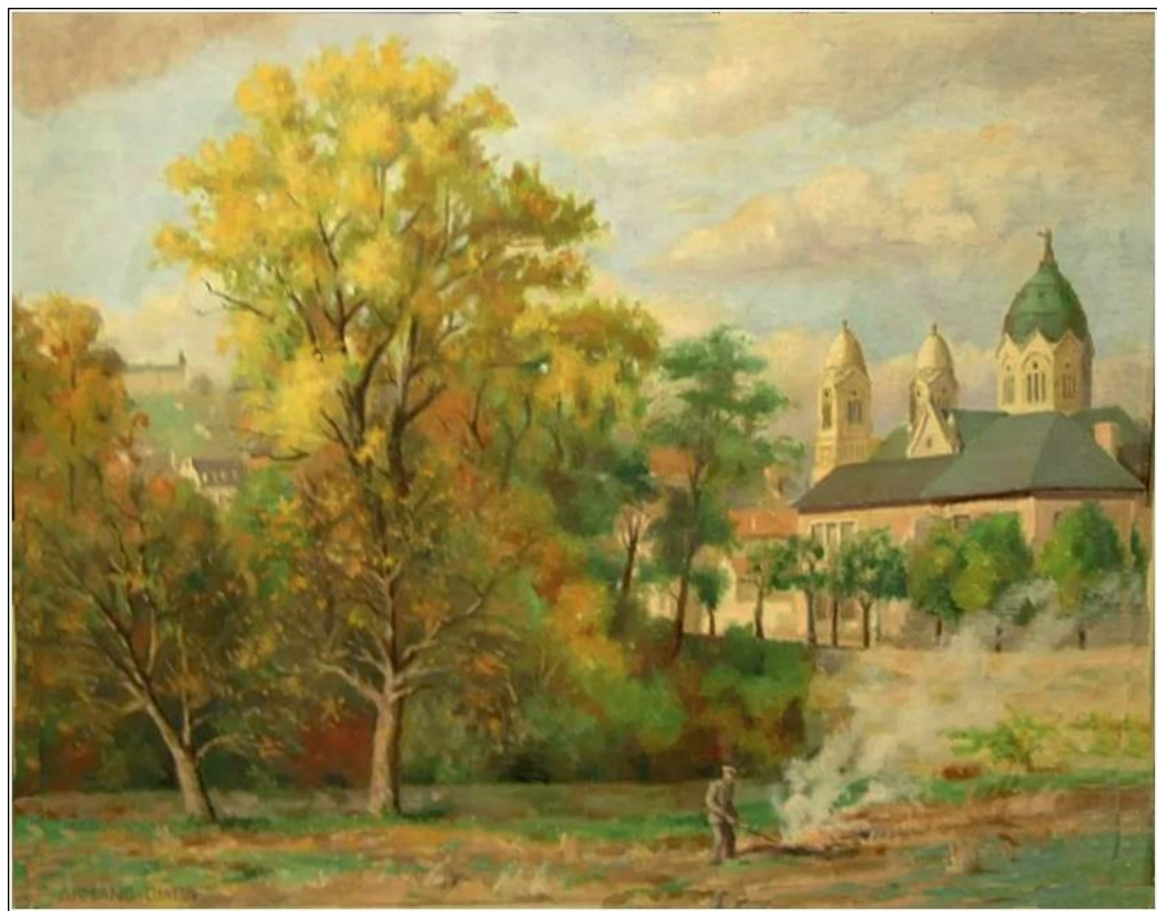
Tableau d'Armand Guidat 7 Le Sacré-Cœur, la Cure d'air, l'école Charlemagne depuis les terrains de la ferme des Sœurs de Saint-Charles