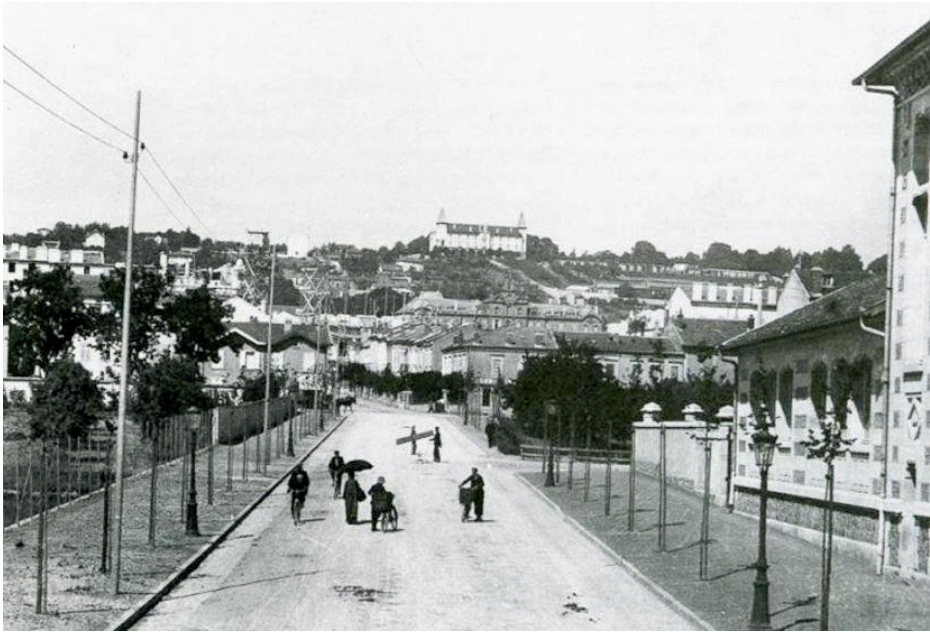
Le nouveau boulevard Charlemagne Groupe scolaire à droite, le domaine des Sœurs de Saint-Charles à gauche, la Cure d'Air dans le fond