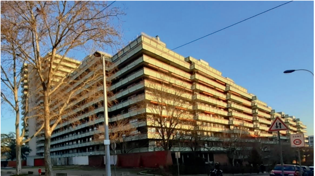
Le Clos vu de la rue Winston Churchill : au fond, l'IUT et à droite, la Cité Universitaire Dans l'angle, une « friche » depuis de nombreuses années