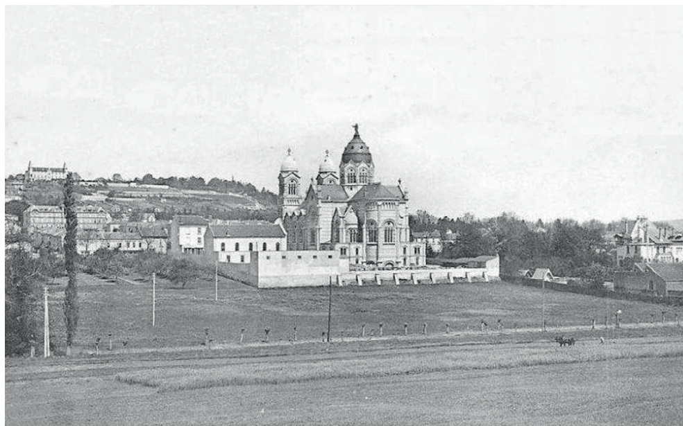
L'enclos de la Basilique du Sacré-Cœur, la Villa Majorelle à droite

Boulevard Charlemagne, Sacré-Cœur et rue de Laxou