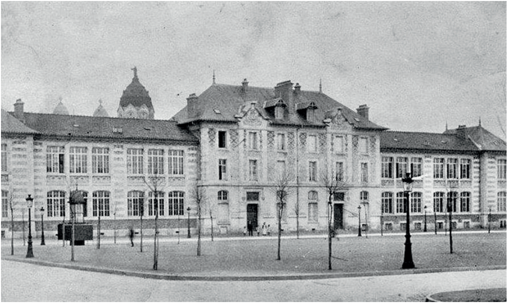
Le groupe scolaire Charlemagne et la place des Ducs de Bar