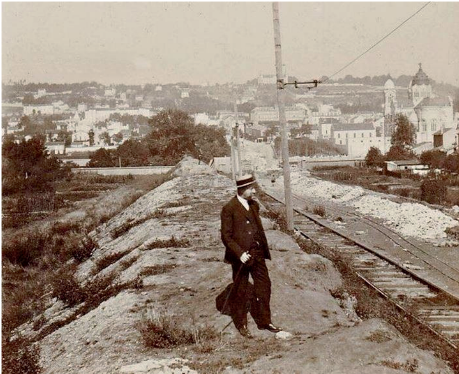
Le remblai de l'enclos de Médreville en 1907, avec la Cure d'Air dans le fond La voie ferrée transportait des wagonnets pour apporter la terre du remblai