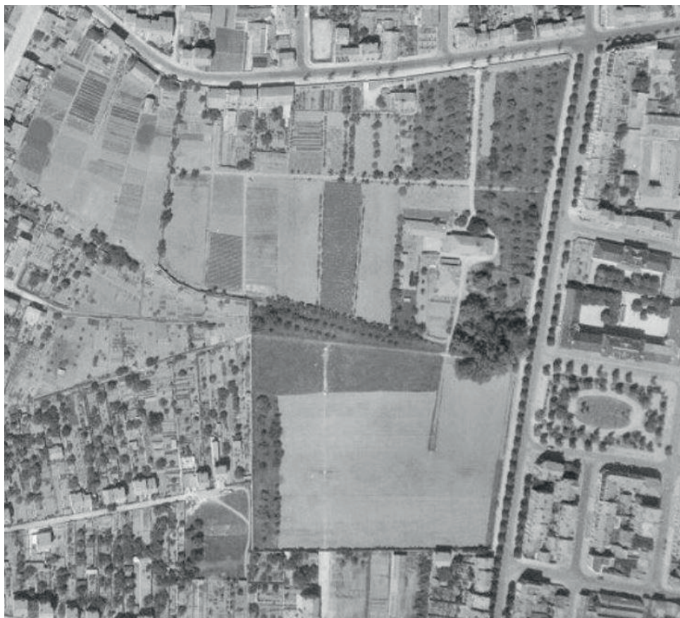
Les terrains des Sœurs de Saint-Charles en 1948, entre boulevard Charlemagne et rue de Laxou