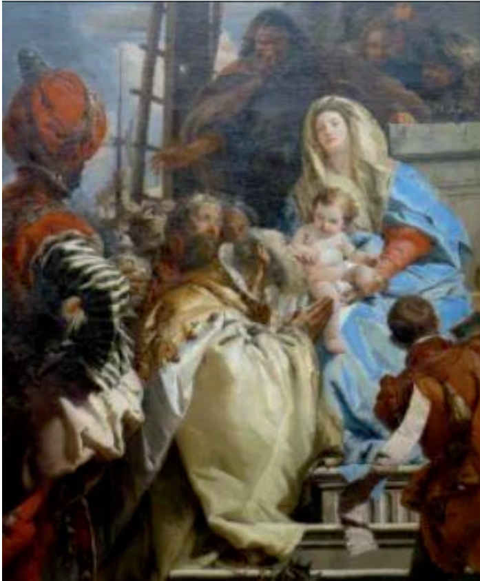
L'adoration des rois mages Gianbattista Tiepolo (1733) Alte Pinakothek (Munich)

Lorsqu'ils furent partis, un ange du Seigneur apparut dans un rêve à Joseph et dit : « Lève-toi, prends le petit enfant et sa mère, fuis en Egypte et restes-y jusqu'à ce que je te parle, car Hérode va rechercher le petit enfant pour le faire mourir. » Joseph se leva, prit de nuit le petit enfant et sa mère et se retira en Egypte. Il y resta jusqu'à la mort d'Hérode, afin que s'accomplisse ce que le Seigneur avait annoncé par le prophète : J'ai appelé mon fils à sortir d'Egypte.