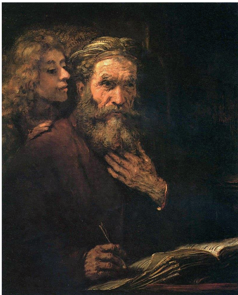
Saint Matthieu et l'ange Rembrandt (1661) Musée du Louvre