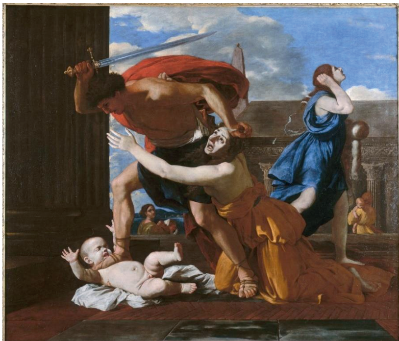
Le massacre des innocents Nicolas Poussin (vers 1628) Musée Condé (Château de Chantilly)

Après la mort d'Hérode, un ange du Seigneur apparut dans un rêve à Joseph, en Egypte, et dit : « Lève-toi, prends le petit enfant et sa mère et va dans le pays d'Israël, car ceux qui en voulaient à la vie du petit enfant sont morts. » Joseph se leva, prit le petit enfant et sa mère et alla dans le pays d'Israël. Cependant, quand il apprit qu'Archélaüs régnait sur la Judée à la place de son père Hérode, il eut peur de s'y rendre. Averti dans un rêve, il se retira dans le territoire de la Galilée et vint habiter dans une ville appelée Nazareth, afin que s'accomplisse ce que les prophètes avaient annoncé : « Il sera appelé nazaréen. »