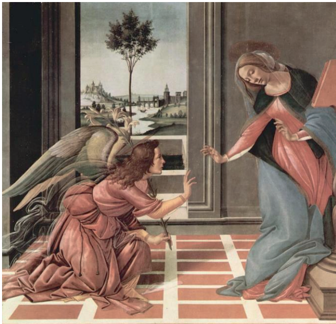
Annonciation à Marie Botticelli (1489) Musée des Offices(Florence)

Tout cela arriva afin que s'accomplisse ce que le Seigneur avait annoncé par le prophète : La vierge sera enceinte, elle mettra au monde un fils et on l'appellera Emmanuel , ce qui signifie « Dieu avec nous ». A son réveil, Joseph fit ce que l'ange du Seigneur lui avait ordonné et il prit sa femme chez lui, mais il n'eut pas de relations conjugales avec elle jusqu'à ce qu'elle ait mis au monde un fils premier-né auquel il donna le nom de Jésus.