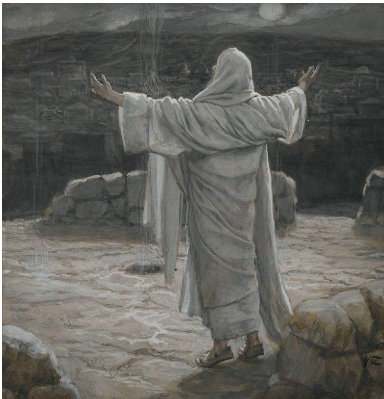
Jésus se retira sur la montagne James Tissot (entre 1886 et 1892) Brooklyn Museum (New-York)