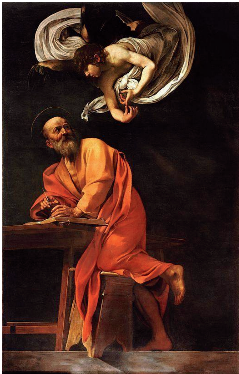
Saint Matthieu et l'ange Le Caravage (1602) Eglise Saint Louis des Français de Rome