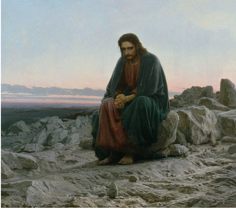
Le Christ dans le désert Ivan Kramskoi (1872) Galerie Tretiakov (Moscou)