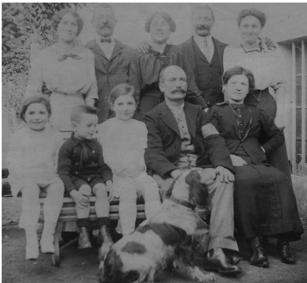
Avec la famille Barral, amie de la famille Boucher (1916)