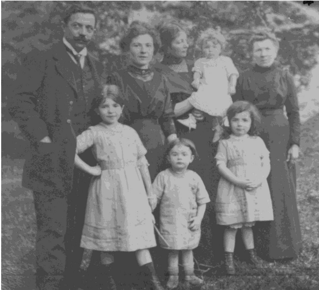
Visite à Conques (1912)