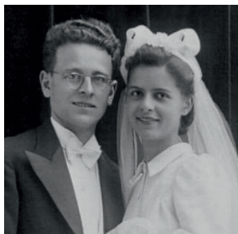
Le 11 avril 1939, amour rime avec toujours

Le couple s'installe au 15 rue du Sergent Blandan à Nancy jusqu'à la mobilisation.