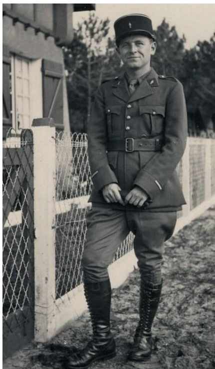
Lieutenant - Bicarosse 1939

Le 2 février 1940 : départ au front ; sa batterie de canons anti-aériens est installée à Crévic près de Dombasle pour protéger les usines Solvay (mais ne sert quasiment pas car les canons tiraient jusqu'à 4000 m et les avions passaient à 6000 !).