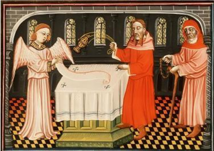
L'annonce à Zacharie Manuscrit enluminé Bible d'Utrecht (IX e siècle)