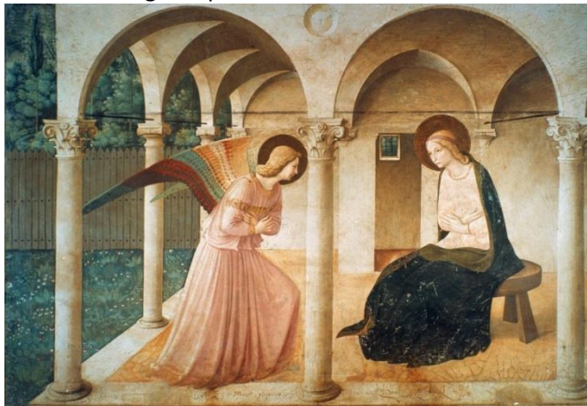
Annonciation Fra Angelico (vers 1440) Couvent San Marco (Florence)

Marie dit : « Je suis la servante du Seigneur. Que ta parole s'accomplisse pour moi ! » Et l'ange la quitta.