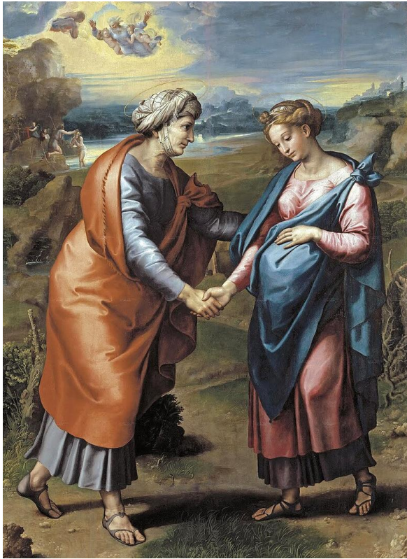
La visitation Raphaël (1518) Musée du Prado (Madrid)