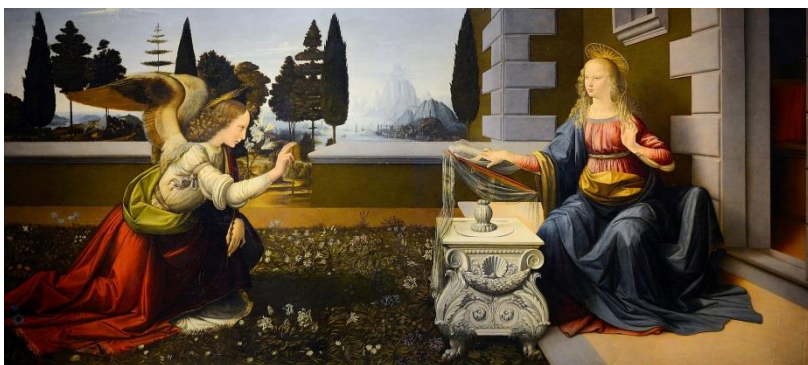
Annonciation Léonard de Vinci, 1472 Galerie des Offices (Florence)